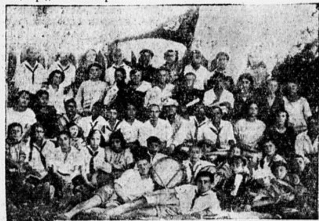
Собрание деткоров тифлисской организации.