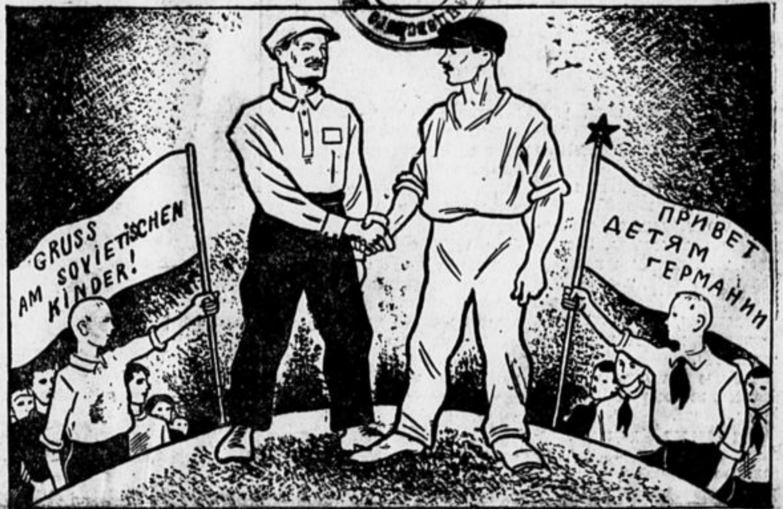
Делегация немецких рабочих поможет установить связь между пионерами СССР и детьми немецких рабочих.